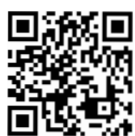
日本ダイエット スペシャリスト協会