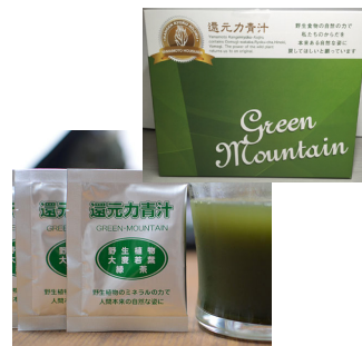
「還元力青汁」(2.5g×66包) 《楽Bioショップ商品番号012》

有機JAS大麦若葉、有機JAS緑茶、植物ミネラル入りの飲みやすい青汁(微粒末健康食品)です。こだわり抜いた原料を使用しているので、安全・安心です。主原料の大麦若葉粉末は熟処理をしていないので酵素が生きています(SOD酵素470万unit)。天然の食物繊維や、健康を維持する為に必要なミネラル・ビタミン類も多く含まれています。活性酸素などの影響で加齢と共に体はどんどん酸化(老化)が進行しますが、酸化還元力はなんとマイナス52mvで還元力の強さが美容効果も期待できます。