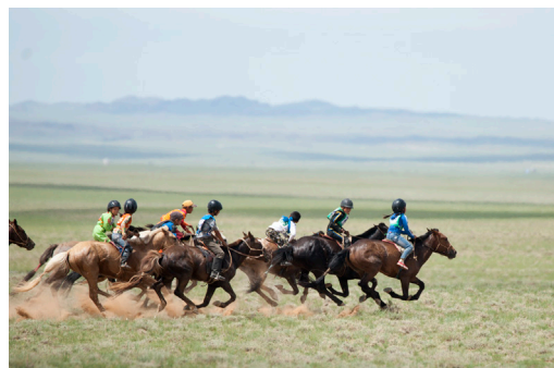
大草原で馬に乗って競争する子どもたち

日本ダイエットスペシャリスト協会の理事長、永田孝行氏の著書です。著者の書籍出版は国内外合わせて62冊で、なんとその販売部数は500万部を突破しています。本書では科学的にダイエットを学ぶための基本テキストとなっており、ダイエットに関する正しい知識が豊富に記載されています。JDSA認定のダイエットスペシャリスト公式テキストでもあります。