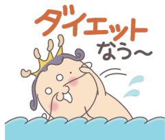
ニューサンキング