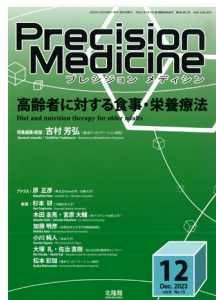
「アレルギーの臨床」 (2023年12月号)