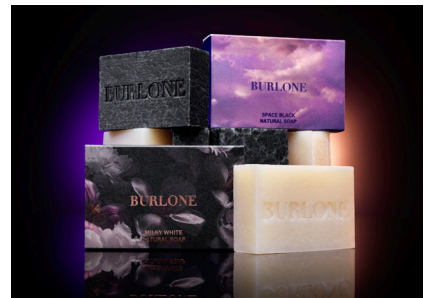
「BURLONE ナチュラルソープ ミルキーホワイト (100g)」 定価 2,985 円税込 「BURLONE ナチュラルソープ スペースブラック (100g)」 定価 2,798 円税込

厳選された素材で肌の弱い方にもおすすめのNS乳酸桿菌発酵液配合ナチュラルソープです。天然成分たっぷりのコールド製法で熟練の職人が丁寧に仕上げた石鹸、BURLONE ナチュラルソープ。豊かな泡立ちで、お肌をしっとり滑らかに保ちます。美容成分も豊富に含まれており、お肌のキメを整える効果も期待できます。また、天然由来の成分なので、肌に優しい使用心地が特徴。