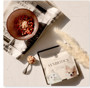
「BIOLY SYNBIOTICS for Pets (40g)」 ペットの腸活ふりかけ・おやつサプリメント 定価 1,896 円税込

腸内で有益な働きをする生菌「プロバイオティクス」と菌を増殖・活性化させて腸内を整える栄養成分「プレバイオティクス」を同時に摂取できる「シンバイオティクス」サプリメントです。BIOLYのペットサプリメントは「ビューマングレード」人間用と同じ品質の原料を採用。フリーズドライ納豆・菊芋粉末・乳酸菌のいずれも人間が摂取しても問題のない良質な原料を使用しています。