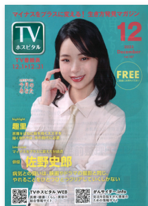
「TV ホスピタル」 (2023年12月号)